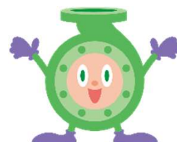
トリシマのマスコットキャラクター「トリポン」