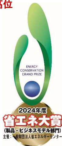
経済産業大臣賞(最高評価)

省エネで先行している欧州のポンプ効率規格で最高グレードにあたる「MEI \geq 0.70」をすべての型番で達成している高効率のポンプです。本ポンプは、従来のエコポンプだけではなく、トリシマがこれまで培ってきた、徹底的に高効率を求められる高圧ポンプや大型ポンプの膨大な水力データをAIに学習させることで、新たな設計データを生み出し、より高性能な製品開発につなげ、従来品より大幅に向上したポンプ効率を実現しています。ポンプの高効率化によって消費電力を抑えることができる本ポンプを使用することで、電気代の節約、CO 2 排出量の削減、モータ容量のダウンサイジングなどが可能となり、お客様の工場などの省エネ課題の解決に貢献することができます。